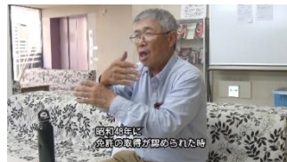
ろうあ者とクルマ 大阪ろうあ会館