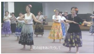
Let's デフラダンス 生駒市福祉センター