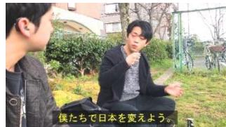
番外編・七人の侍 近畿ろう学生懇談会