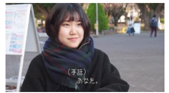
静かなクリスマス シネマウント・フィルム・パーティー