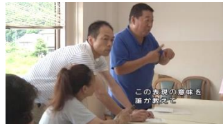
能登就労支援事業所 やなぎだハウスの開所 石川県聴覚障害者センター