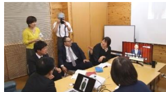
『令和』の手話表現ができるまで 聴結び