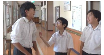
絆大作戦 京都府立聾学校中学部 2年