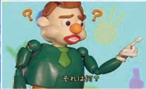
特別賞(2010年度) 「人形アニメーションで学ぼう 千葉の地方手話」 千葉聴覚障害者センター(千葉県)