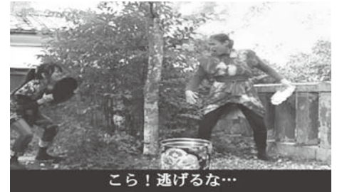
「わる柿」手話舞台「箱!」(京都府) (2010年度)

障害者や障害者を含むグループが、監督、キャスター、カメラマン、出演者等として制作した映像作品を上映します！ また、審査を行い優秀作品を発表いたします！