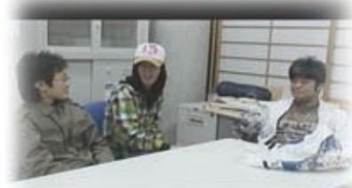
未来学生 (The future student)

『未来学生 (The future student)』(2008年/12分45秒)