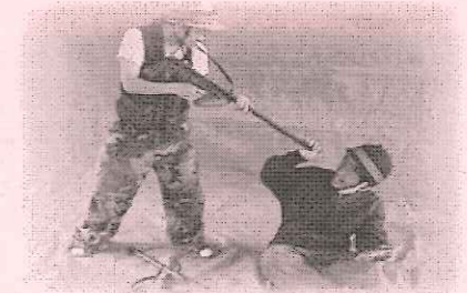
ブラザー・ポット