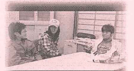
未来学生 (The future student)