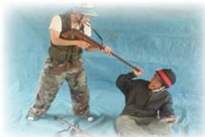
ブラザー・ポット