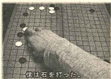
「僕と彼女と碁盤の幽霊」