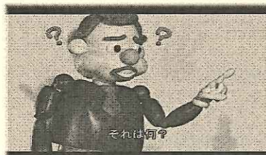
「人形アニメーションで学ぼう 千葉の地方手話」