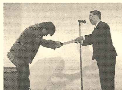
昨年度 表彰式の様子